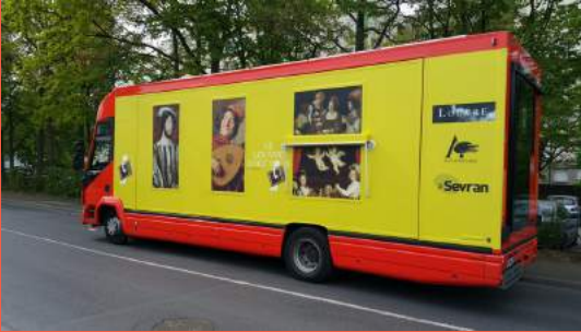
Camion itinérant de prêt de reproductions d'oeuvres"