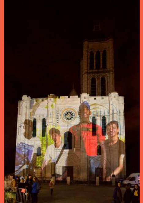
Projection des photographies réalisées par les Dionysiens