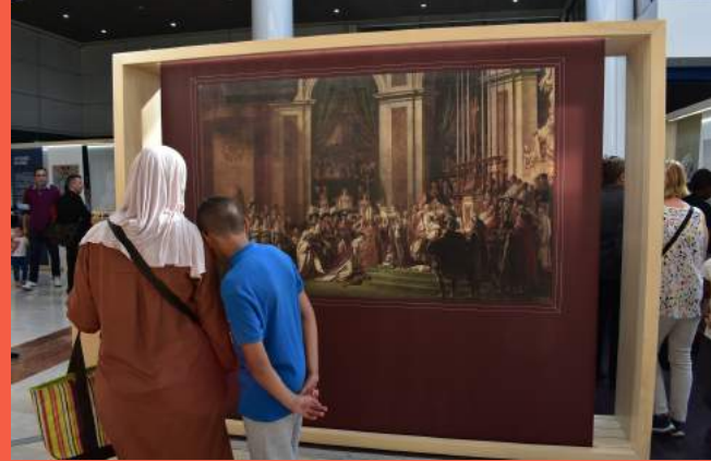
Exposition au centre commercial "Beau Sevrans"