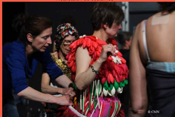
Réalisation de costumes

Le projet s'est développé autour de trois thématiques complémentaires : les costumes, les coutumes et la mode. Les costumes ont été présentés dans le cadre d'une exposition au château de Champs-sur-Marne.